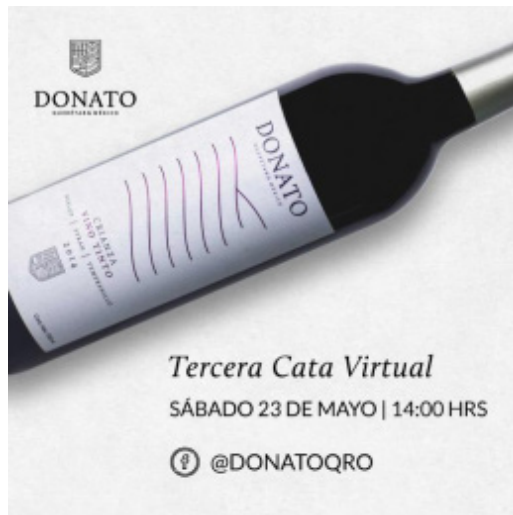
Tomado de https://www.facebook.com/photo/?fbid=2340328642934193&set=a.1696907927276271